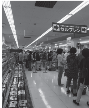
▲オープン当日の店内様子

そこで市から土地の取得予定者であるスタートデベロップメント株式会社に対し、再度、市民生活への影響を軽減するための、暫定店舗での営業について協議し、その結果相手側の理解もい