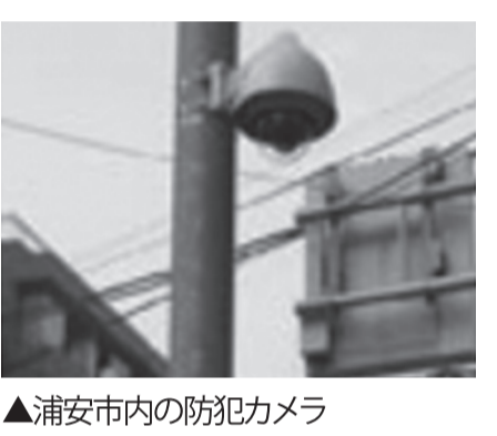
▲浦安市内の防犯カメラ

み全24基の防犯カメラに加え、これまでの警察との協議を踏まえ、5基の防犯カメラの新設を行うための予算です。自身としても市議会にて防犯カメラの増設を訴えてきたところであり着実に進めていただきたい分野です。